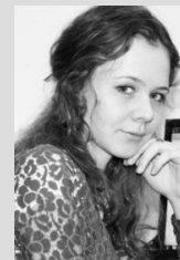
Помощь в подготовке выпуска: