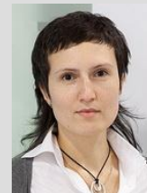
Выпуск подготовила: Эльвира Алейниченко

адрес г. Москва, ул. Суцеская, дом 9, стр. 4, офис 311